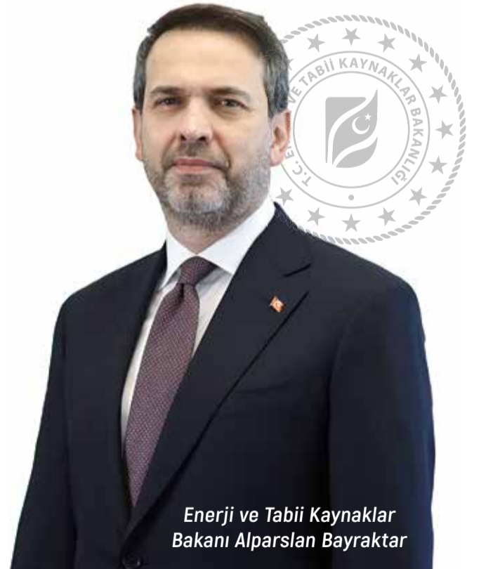
Enerji ve Tabii Kaynaklar Bakanı Alparslan Bayraktar

Türkiye artık yalnızca enerji tüketen bir ülke değil; Afrika'dan Asya'ya uzanan geniş bir coğrafyada petrol ve gaz arayan küresel bir enerji oyuncusu.