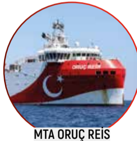
MTA ORUÇ REİS