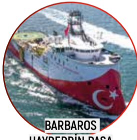
BARBAROS HAYREDDİN PAŞA