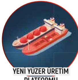
YENİ YÜZER ÜRETİM PLATFORMU

Türkiye artık yalnızca enerji tüketen bir ülke değil; Afrika'dan Asya'ya uzanan geniş bir coğrafyada petrol ve gaz arayan küresel bir enerji oyuncusu.