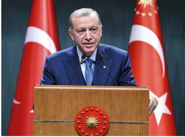
Hyundai'nin İzmit'teki fabrikasında tamamen elektrikli araç üretimine geçeceğini söyledi.

Güney Kore Cumhurbaşkanı Lee Jae Myung ile Cumhurbaşkanlığı Külliyesi'nde yaptıkları görüşmeye değinen Erdoğan,