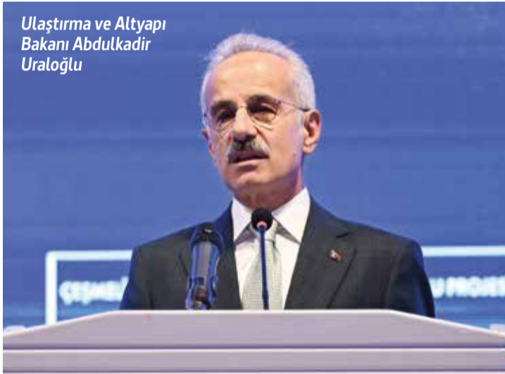
Ulaştırma ve Altyapı Bakanı Abdulkadir Uraloğlu