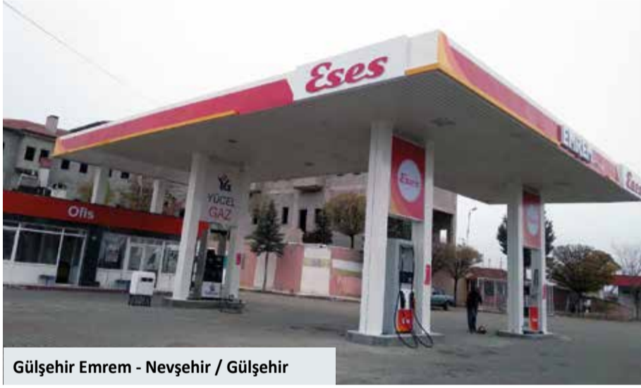
Gülşehir Emrem - Nevşehir / Gülşehir