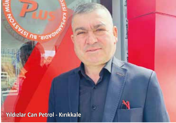
Yıldızlar Can Petrol - Kırıkkale