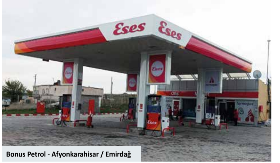
Bonus Petrol - Afyonkarahisar / Emirdağ