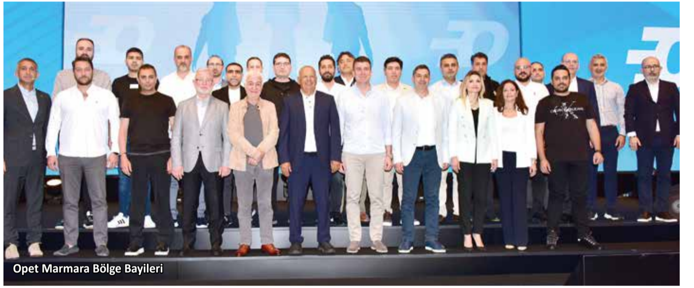
Opet Marmara Bölge Bayileri