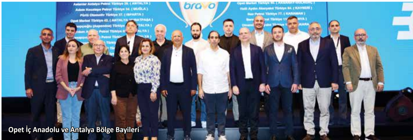
Opet İç Anadolu ve Antalya Bölge Bayileri