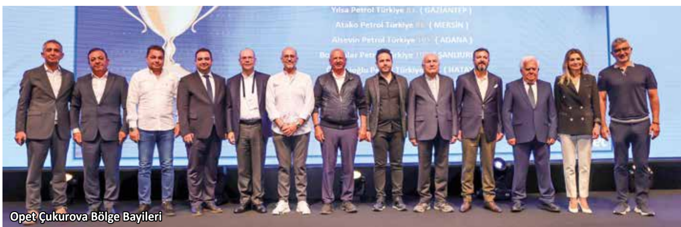
Opet Çukurova Bölge Bayileri