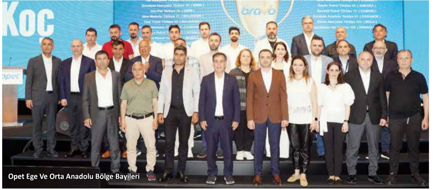
Opet Ege Ve Orta Anadolu Bölge Bayileri

“İş ortaklarımız ile birlikte olmak her zaman bize güç ve enerji veriyor” diyerek söze başladı ve şöyle devam etti: “Bugüne kadar müşteri odaklı ve kusursuz hizmet anlayışımızla birçok ürüne ve birçok yeniliğe imza attık. Bu sayede müşterilerimizin gönüllerinde taht kurduk ve Lovemark olmayı başardık. 30 yıl gibi bir kısa sürede çok hızlı büyüdük ve Türkiye’de 100 yıldan fazla zamandır bulunan küresel markaları geçme başarısı ortaya koyan yenilikçi, en çok tercih edilen ve lider marka olduk. Bu başarıları değerli bayilerimize borçluyuz. 2023 yılında sektörün yüzde 3 büyümesi bekleniyor, biz de OPET olarak pazar payımızı yüzde 19’dan yüzde 20.5’e çıkartmayı hedefliyoruz. Yılın ilk verileri de bu hedefimizi destekliyor. Daha da önemlisi kanopi altında bireysel pazarda en çok büyüyen marka olmayı başardık. Ama önemli olan lider olmak değil lider kalmak... Birlik beraberlik, dayanışma içerisinde, sürekli takım oyunu oynayarak ve iş birliği geliştirerek yeni rekorlara hep beraber koşacağımıza inanıyorum.”