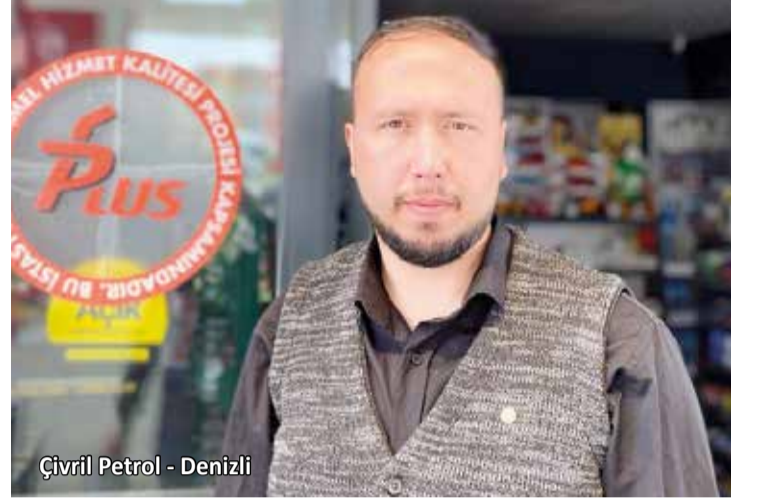
Çivril Petrol - Denizli