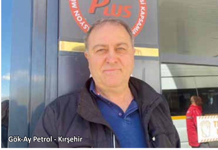
Gök-Ay Petrol - Kırşehir