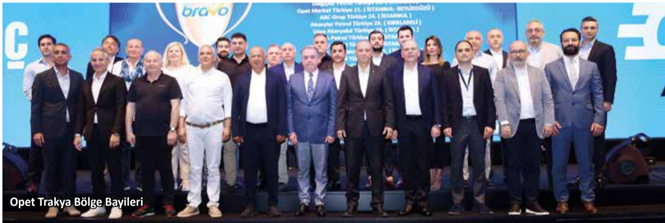
Opet Trakya Bölge Bayileri