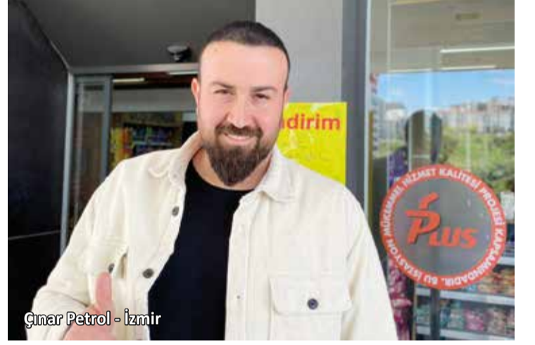
Çınar Petrol - İzmir