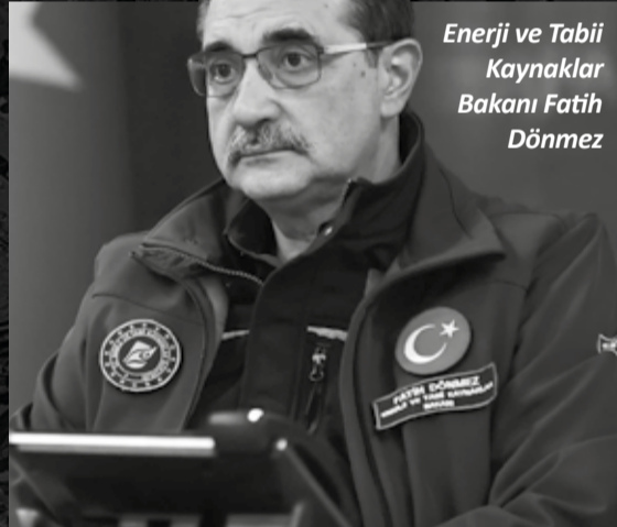
Enerji ve Tabii Kaynaklar Bakanı Fatih Dönmez

Kamu kurumları, sivil toplum kuruluşları ve şirketleriyle ülkemiz enerji sektörü 'asrın felaketi' sonrası tek yürek oldu. Merkez üssü Kahramanmaraş olan ve 11 ilimizi etkileyen depremin yaralarını sarmak için sektör tüm imkanlarıyla seferber oldu.