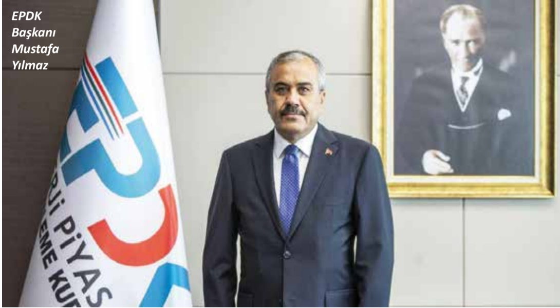
EPDK Başkanı Mustafa Yılmaz

Dağıtıcı ve bayilik lisansı sahiplerinin akaryakıt ikmallerine ilişkin kısıtları da 6 Şubat'tan itibaren OHAL süresi