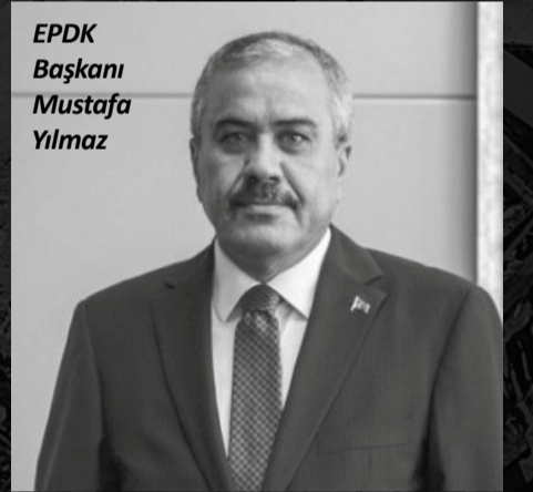
EPDK Başkanı Mustafa Yılmaz