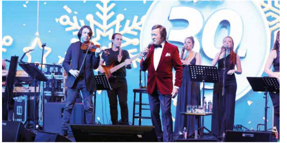
OPET'in 30'uncu Yıl kutlaması Türk Pop Müziği'nin önemli isimlerinden Erol Evgin konseri ile sona erdi.

Opet'in 30. kuruluş yıl dönümünü kutladım, nice 30. yıllara” dedi.