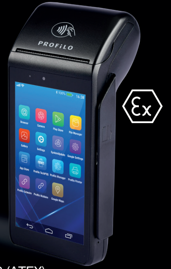
AndroidPOS Profilo P1000 (ATEX)