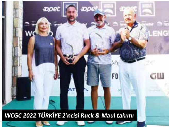
WCGC 2022 TÜRKİYE 2'ncisi Ruck & Maul takımı