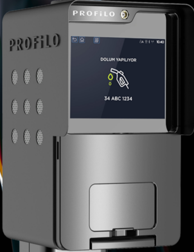
Yeni Nesil Pompa Yazar Kasa Profilo PYK-9000