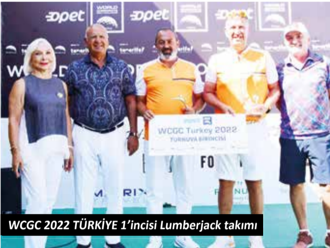
WCGC 2022 TÜRKİYE 1'incisi Lumberjack takımı

- Dünya Kurumsal Golf Turnuvası, 1993'ten beri yaklaşık 1 milyon golfçünün katıldığı ve 2013 yılından beri de Türkiye'de düzenlenen dünyanın en geniş katımlı kurumsal golf turnuvası olma özelliği gösteriyor. Turnuva 2015 itibarıyla 34 ülkede yapılıyor ve kazanan takımlar her yıl Dünya Finali'nde buluşuyor. Şirketler turnuvada bir araya gelerek hem ülkelerini hem de şirketlerini temsil ediyor.