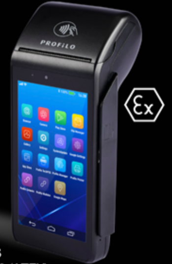
AndroidPOS Profilo P1000 (ATEX)

Çok yakında akaryakıt istasyonlarında! Detaylı bilgi ve ön sipariş için: