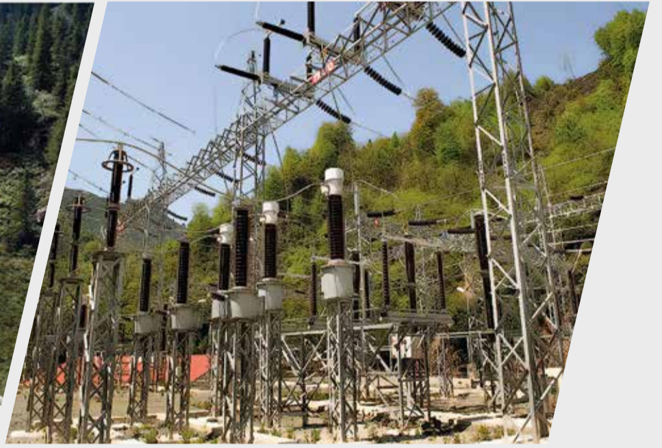
SARMAŞIK II HES