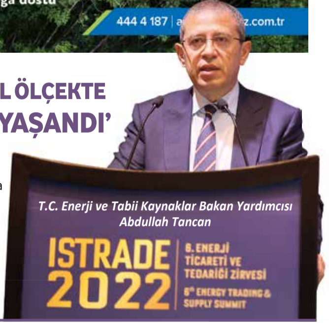
T.C. Enerji ve Tabii Kaynaklar Bakan Yardımcısı Abdullah Tanca

■ ISTRADE 2022'nin açılışında konuşan T.C. Enerji ve Tabii Kaynaklar Bakan Yardımcısı Abdullah Tanca, salgın süreciyle bütün alanlarda olduğu gibi enerji alanında da küresel ölçekte önemli değişiklikler yaşandığına dikkat çekti: "Dünyada emtia fiyatlarındaki beklenmeyen artışlar bütün ticari piyasaları olumsuz etkiledi. Bu olumsuz etkilerden arz güvenliğinin ve tüketicilerin korunması amacıyla Elektrik Piyasası Kanunu'nda yapılan değişikliklerle maliyeti yüksek üreticilerin ve tüketicilerin desteklenmesi için 'destekleme bedeli' uygulaması devreye alındı." >> 6