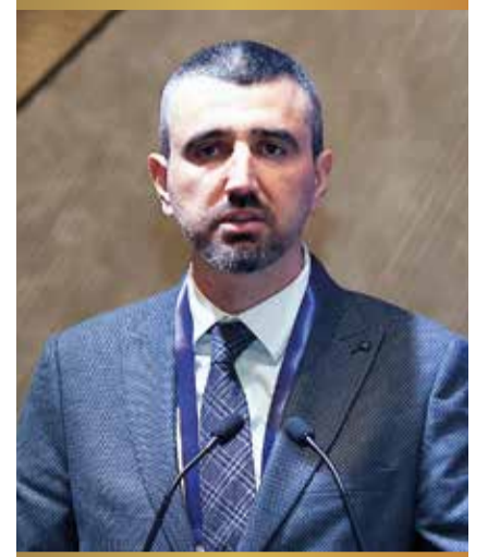
Enerjisa Üretim CEO'su İhsan Erbil Bayçöl

Hepimizin malumu 2020, 2021 ve 2022 bugüne kadar sıra dışı, zorlayıcı bir süreç oldu. Hemen hemen bütün sektörler, bütün şirketler için excel dosyalarında ekstrem senaryo diye yazan şeyler hayatımızın bir parçası oldu. Bu zorlayıcı unsurdan Enerjisa Üretim olarak kendi yol planımızı çıkarmaya çalışırken, hissedarlarımızla, paydaşlarımızla fikir alışverişi yaparken bu süreçlerde üç şeyin öne çıktığını görüyoruz; bir tanesi liberalleşme unsurları, diğeri insan gücü ve üçüncüsü, ayrıca en önemlisi de arz talep dengesini yönetmek için yatırımların devam etmesi. Bu noktada Türkiye'nin yenilenebilir alanında tekrar bir ivme kazanması gerektiğini düşünüyoruz. Bu konuda da Enerjisa Üretim olarak