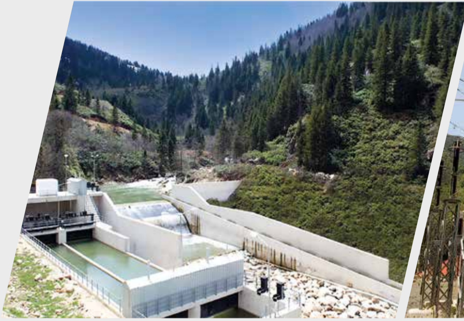
SARMAŞIK I HES