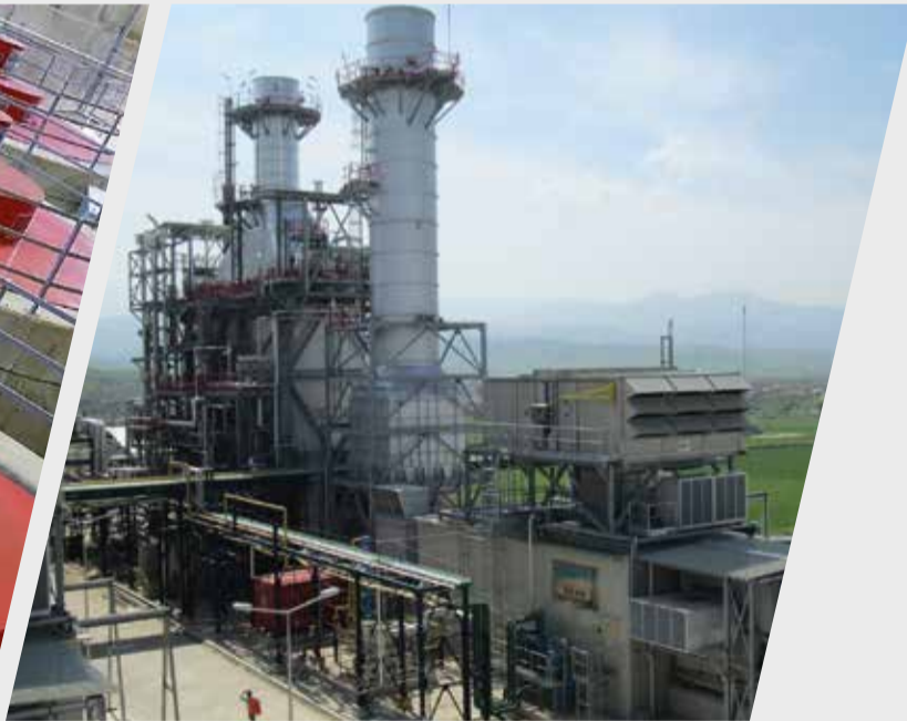
AGE DOĞALGAZ KOMBİNE ÇEVİRİM SANTRALİ