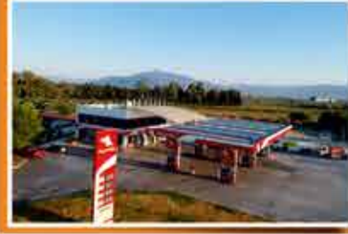
İzmir - As Mira Petrol