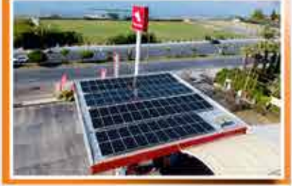
Antalya - Kestel Yüceller Petrol