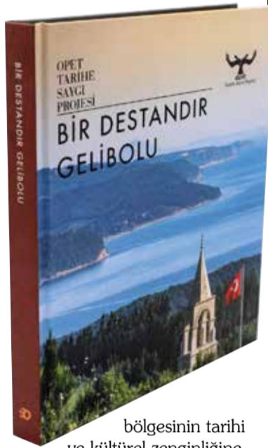
bölgesinin tarihi ve kültürel zenginliğine de yer verildi.

OPET'in tarihi Gelibolu Yarımadası'nın doğal dokusunu koruyarak, çağdaş bir görünüme kavuşması hedefiyle 2006 yılında başlattığı "Tarihe Saygı Projesi" yolculuğu, "Bir Destandır Gelibolu" adı ile geçtiğimiz yıl kitap haline getirildi. OPET'e 'Kurumsal Yayınlar' kategorisinde Prida getiren çalışma, Arzu Karamani Pekin tarafından kaleme alındı. Kitapta, proje kapsamında Alçıtepe, Seddülbahir, Bigalı, Kilitbahir, Kocadere, Behramlı, Küçük ve Büyük Anafarta köyleri ile Eceabat ilçesindeki yenileme ve düzenleme çalışmalarının yanı sıra, 57. Alay Şehitliği, Akbaş Şehitliği, Tarihe Saygı Ortaokulu ve Çanakkale Şehitler Anıtı Mescit'inde gerçekleştirilen düzenlemeler fotoğraflarla anlatıldı. Kitapta ayrıca Çanakkale Savaşı'nda kahramanca canlarını veren şehitlerimize yakışır bir düzenlemeyle yeni bir çehreye kavuşan Gelibolu Yarımadası Ecebat