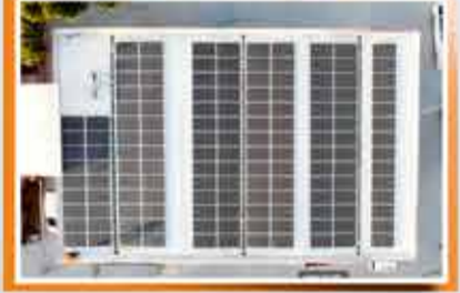
Aydın - Jappa Petrol