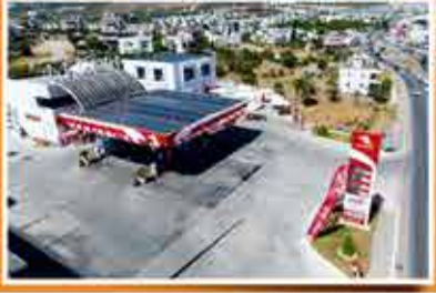
Muğla - Paşolılar Petrol