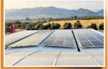
İzmir - Uludağ Kardeşler Petrol