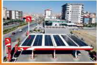
Ankara - Kadem Petrol