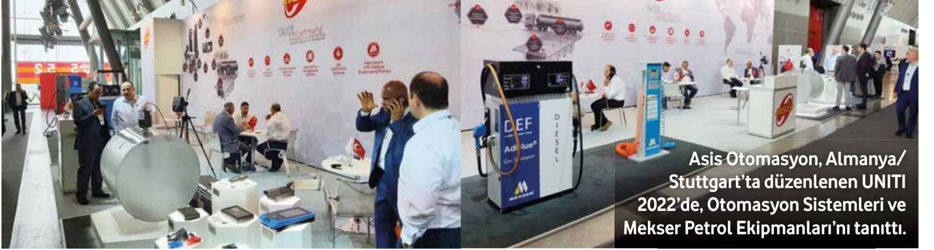
Asis Otomasyon, Almanya/ Stuttgart'ta düzenlenen UNITI 2022'de, Otomasyon Sistemleri ve Mekser Petrol Ekipmanları'nı tanıttı.

Asis Otomasyon, 17-19 Mayıs 2022 tarihlerinde Almanya/Stuttgart'ta düzenlenen UNITI 2022'ye katılarak, akaryakıt sektörüne sunduğu çözüm ve hizmetlerini, hem Asis Otomasyon Sistemleri hem de Mekser Petrol Ekipmanları ile dünyanın beğenisine sundu.