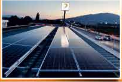
İzmir - Genceroglu Petrol