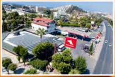
Antalya - Ali Şahin Petrol