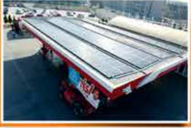
İzmir - Yaman Petrol